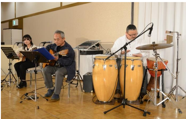
♪ファンキー南グループ♪