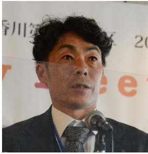
東かがわ R C