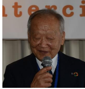
琴平 R C