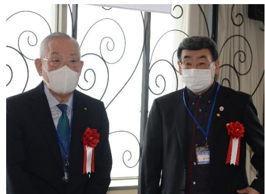
豊田パスタガバナー 前田パスタガバナー