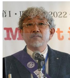
丸亀東 R C