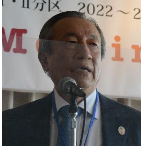
善通寺 R C