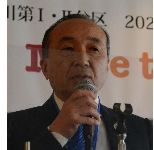
高松東 R C