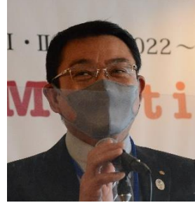
高松西 R C