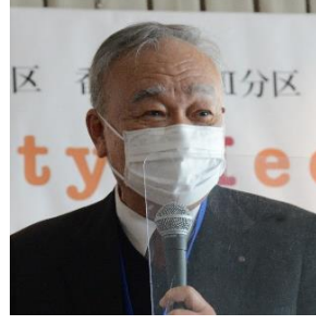
坂出東 R C