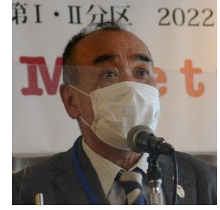
さぬき R C