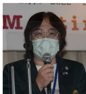
高松グリーン R C