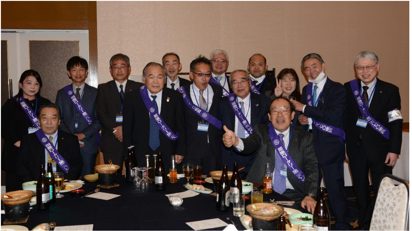
丸亀東ロータリークラブ