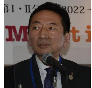
高松北 R C