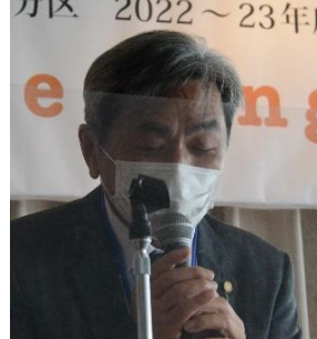
丸亀 R C