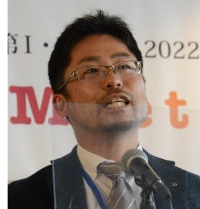
観音寺東 R C