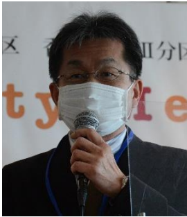
高松中央 R C