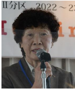
観音寺 R C