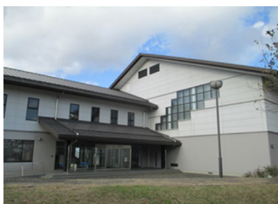
大会会場 ; サンビレッジ土器川