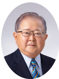
国際ロータリー第2670地区 2025-2026年度 ガバナー