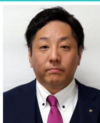
浪花 穰 善通寺 RC